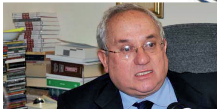
Salvatore Di Landro, procuratore generale di Reggio Calabria

Proiettili e minacce anche ad alcuni cronisti che si occupano con coraggio di inchieste sulla 'ndrangheta e i suoi collegamenti con la "zona grigia". Le operazioni più recenti Meta e Crimine hanno confermato la pericolosità della 'ndrangheta, la sua capacità di infiltrazione nella società e nelle istituzioni e hanno rivelato anche la sua struttura unitaria. La svolta data dalla magistratura inquirente è sotto gli occhi di tutti, basti pensare come veniva definita un tempo la Procura generale: «Corte dei miracoli». Si è aperta una fase innovativa che coinvolge tutti gli uffici del Tribunale, e la procura generale, come organo apicale, svolge un'azione propulsiva. «Basti pensare», spiega ancora Di Landro, «che il nostro ufficio cura i fascicoli delle confische. Inoltre con il patteggiamento in appello, è finita la stagione dei saldi. Il terreno